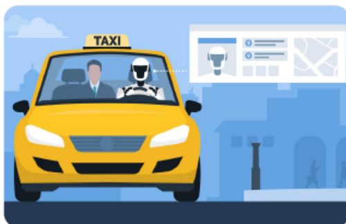
Illustration / Alamy / IPA